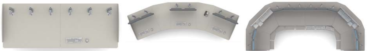
Рис. 3. Варианты конфигураций столов операторов

Система MasterRack является экономичной альтернативой импортной технической мебели. MasterRack - полностью сборно-разборная система и, в отличие от систем на сварных каркасах, обладает несомненным удобством при перемещении и разворачивании на новом месте.